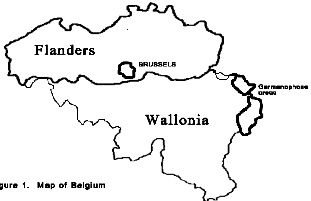
Figure 1. Map of Belgium